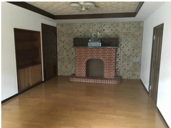
1階洋室 14 丈