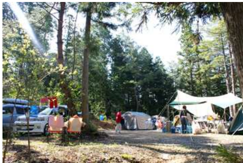
豊かな自然を生かしたキャンプ場