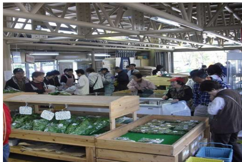
農林水産物の販売拠点施設（道の駅）