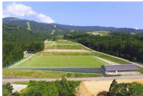
スポーツツーリズム拠点となる吹高原スポーツ広場