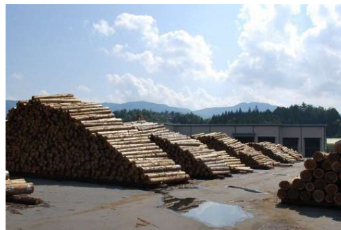
大型製材工場の木材集荷状況