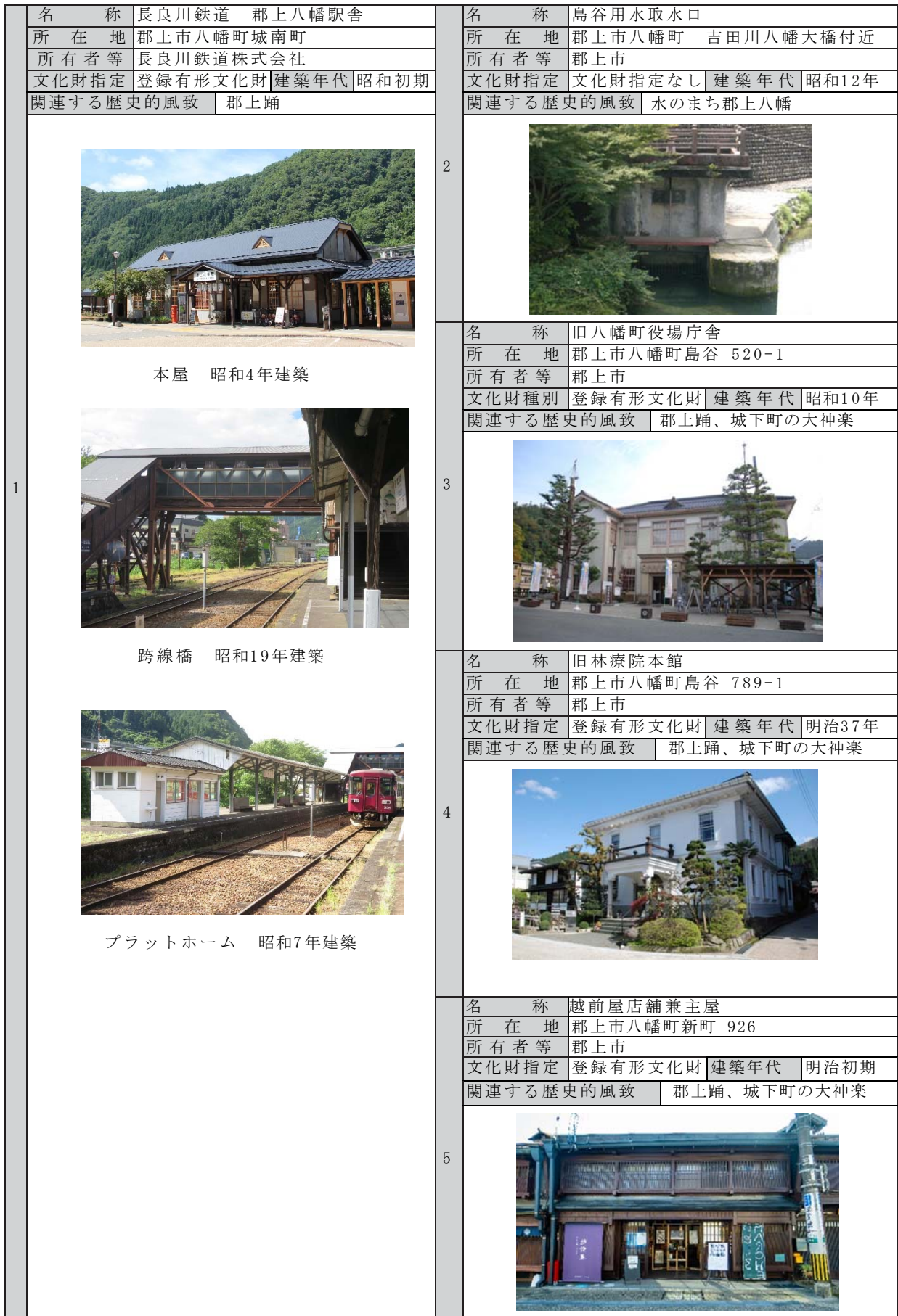
7-2 歴史的風致形成建造物候補一覧