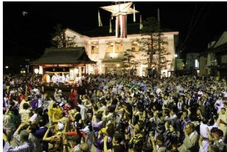
発祥祭(旧八幡町役場庁舎前)

郡上踊は近世の城下町で踊られていた盆踊りを体系化しながら継承されてきた。城下町の町割を継承した歴史的な町並みに、お囃子と踊りが溶け込んで歴史的風致を生み出している。