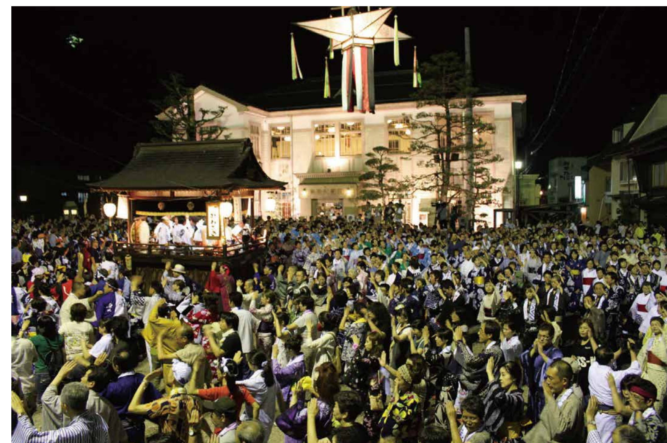
7~9월에 개최되는 ‘구조오도리 춤’의 모습. 누구나 참여할 수 있어 관광객과 지역 사람들이 하나가 되어 춤을 춘다. Gujo Odori Bon Dance held from July to September each year. All are welcome to take part, and many tourists join the locals in the dances.

구조하치만에 대해 더 자세히 알고 싶으신 분은 구조시 홈페이지를 참조하시기 바랍니다.