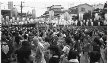
▲友好交流協定で交流促進 市と市観光連盟は、6月21日(土)歴史的な縁や郡上おどりin青山で関係の深い東京都港区、青山外苑前商店街振興組合と友好交流協定を結びました。また、恒例の「第15回郡上おどりin青山」も開かれ、延べ4,500人がおどりを満喫しました。