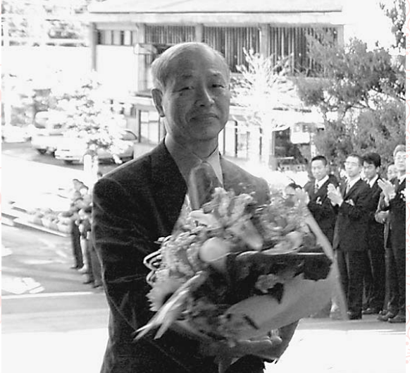
▲4月11日(金)日置敏明市長が初登庁 4月10日(木) 碓孝司前市長、森弘彦前副市長が退任され、翌11日、2代目の市長に就任した日置敏明市長が初登庁されました。市役所玄関で職員らが拍手で出迎え、笑顔で市長室に入られました。