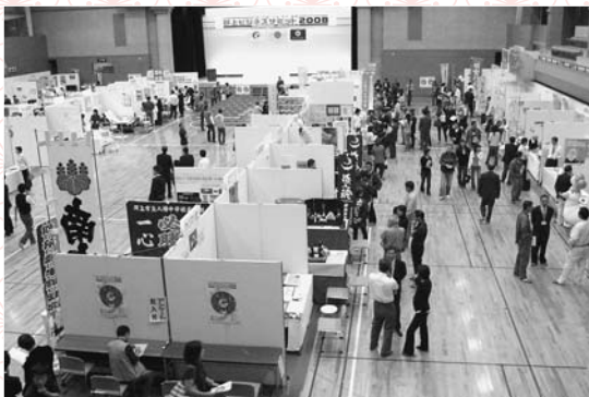
◀産業の発展めざす! 初のビジネスサミット開催「郡上の技」交流・創造・挑戦をテーマに、ビジネスマッチングや販路拡大、雇用確保など郡上市産業界の発展をめざす「郡上ビジネスサミット2008」が、10月18日(土)・19日(日)の2日間、やまと総合文化センターで開催され、延べ2,267人の入場者が訪れました。また、当日は「郡上ブランド認定制度」の発表も行われ会場は賑わいました。