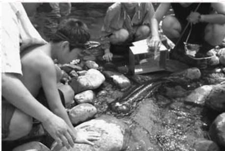
▲和良川が平成の名水100選に認定(環境省) 和良川は国の天然記念物のオオサンショウウオの生息地でもあり、地域住民が中心となって水環境の保全活動や子どもたちに環境教育などを行い、水の大切さを伝えていきます。