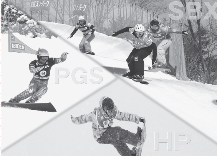
▲イビデンスペシャルNOKIAスノーボードFISワールドカップ2008GIFU/GUJO大会 2月22日(金)～24日(日)の3日間、高鷲スノーパークにおいて開催されました。市民参加の世界大会として、団体や個人の多くのボランティアが大会スタッフやサポートとして活躍。市民一丸となって支え成功のうちに終わりました。また、市内小中学生も応援に訪れ、世界最高峰の技を目の前にし、熱い声援を送りました。