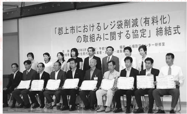
▲レジ袋有料化協定締結—郡上市と住民団体、事業者、岐阜県— 市におけるレジ袋削減(有料化)の取り組みに関する協定の締結式が8月1日(金)八幡防災センターで開かれました。協定では、市内自治会や女性の会、シニアクラブなどでつくる環境団、県、市の三者と各事業者の間で行われ、市内6社11店が10月1日(水)からレジ袋の有料化を開始しました。