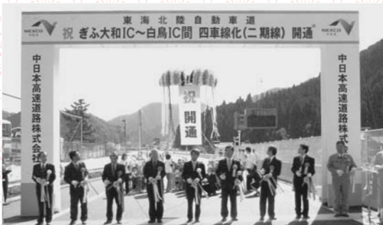
▲渋滞解消や地域活性化が期待!—東海北陸自動車道全線開通・四車線化— 7月5日(土)東海北陸自動車道が全線開通し、北陸と郡上はノンストップ2時間で交流が可能となりました。また、瓢ヶ岳PA～郡上八幡IC間、ぎふ大和IC～白鳥IC間の四車線化も開通し、さらなる高速道路網の飛躍が期待できます。