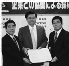
▲森林づくり協定を締結 2月6日(水)、ブラザー工業(株)市、県との3者での協働による森林づくり協定が結ばれました。6月14日(土)白鳥町二日町の延年の森地内で「ブラザーの森郡上」植樹記念式が行われ、ブラザー工業の従業員やその家族ら90人が、モミジャクリ、ブナなど広葉樹200本を植樹しました。