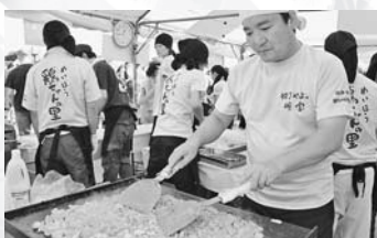
▲奥美濃カレーとめいほう鶏ちゃん(初出場)第5回B-1グランプリ(神奈川県厚木市)出場(9/18~19)