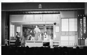
▲高雄歌舞伎 東京青山公演(10/24) 【東京都港区との伝統芸能交流】