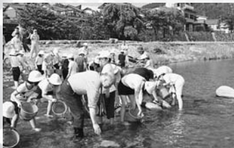
▲第30回全国豊かな海づくり大会 郡上市サテライト大会(6/12)