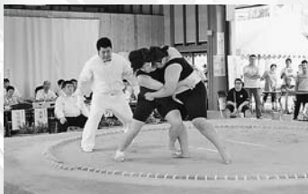
▲第1回全日本女子相撲 郡上大大会開催(9/5)