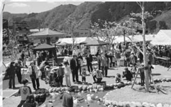
▲郡上八幡中央公園竣工式(4/25)