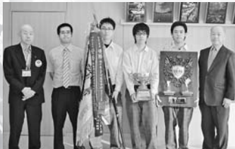
▲郡上北高等学校射撃部 第48回全国高等学校ライフル射撃競技選手権大会エアー・ライフル男子団体優勝(7/28~31)