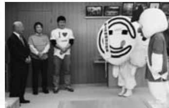
▲郡上市特命宣伝部長に任命 (11/7)