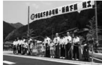
▲市道森下赤小場線竣工式 (8/11)