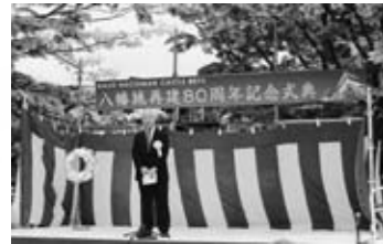
▲八幡城再建80周年記念セミナー (5/19)

みなさん、2013年（平成25年）はどんな一年でしたか？広報郷上は、No107号～No118号の12冊を発行しました。イベントや各種催しを初め、叙勲や大臣表彰の受賞、全国大会出場者激励など、例年になく多くの方が活躍した一年であったような気がします。今月号では2013年（平成25年）の郡上市の主な出来事を振り返ります。