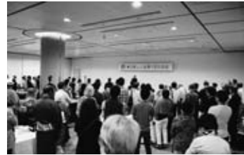
▲東京郡上人会第1回交流会を開催 (6/29)