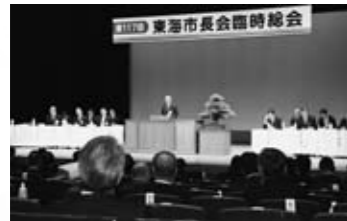
▲第117回東海市長会臨時総会 (10/23)