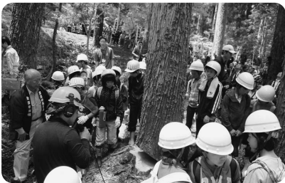
▲郡上市みどりの祭り(美並町)(5/23)