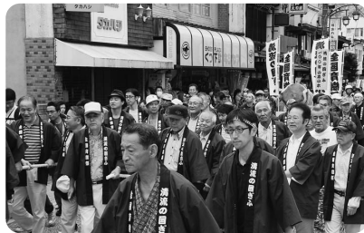
▲100年の森づくりリレー(八幡町)(6/7)