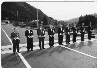
▲国道156号大和改良万場大橋渡り初め式(11/21)