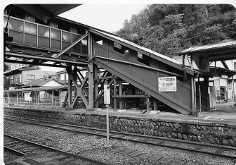
▲長良川鉄道郡上八幡駅が国の登録有形文化財(建造物)に指定(8/4)