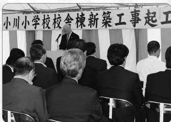
▲小川小学校校舎棟新築工事起工式(8/20)