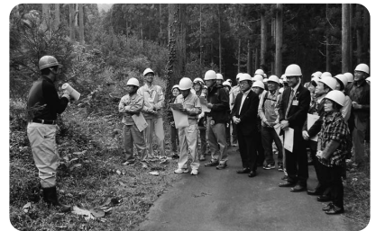
▲育林現地見学会(高鷲町)(10/10)

①郡上っ子応援宣言(1/15) ②県北西部地域医療センター協定書調印式(3/30) ③市道愛宕桜町線八幡橋完成(4/5) ④新たな発電施設が完成(県が白鳥町石徹白地内で整備を進めてきた農業用水を活用した石徹白1号用水発電所(現在は、石徹白清流発電所)の通電式が行われ、発電が始まりました。▼中部電力は、県営阿多岐ダムの放流水を活用した阿多岐水力発電所の完工式を行いました。県営ダムの放流水を使った水力発電は、県内で初めて。 ⑤全国育樹祭を盛り上げるイベントを郡上市でも開催 ①森林の恵みや森林を守り育てることの大切さについて考える「郡上市みどりの祭り」、100年の森づくりリレー「伐採式」が美並町で行われ、伐採されたスギは、八幡町 ①郡上っ子応援宣言(1/15) ②県北西部地域医療センター協定書調印式(3/30) ③市道愛宕桜町線八幡橋完成(4/5) ④新たな発電施設が完成(県が白鳥町石徹白地内で整備を進めてきた農業用水を活用した石徹白1号用水発電所(現在は、石徹白清流発電所)の通電式が行われ、発電が始まりました。▼中部電力は、県営阿多岐ダムの放流水を活用した阿多岐水力発電所の完工式を行いました。県営ダムの放流水を使った水力発電は、県内で初めて。 ⑤全国育樹祭を盛り上げるイベントを郡上市でも開催 ①森林の恵みや森林を守り育てることの大切さについて考える「郡上市みどりの祭り」、100年の森づくりリレー「伐採式」が美並町で行われ、伐採されたスギは、八幡町