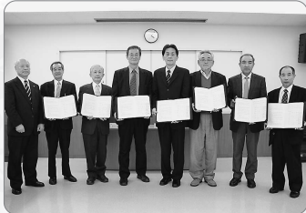
▲自治会連合会災害協定調印式(3/24)