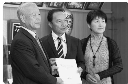
▲郡上市まち・ひと・しごと総合戦略(案)市長報告(10/30)