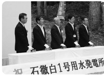
▲石徹白1号用水発電所通電式(6/1)