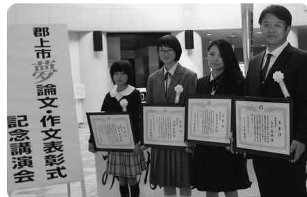
▲夢論文・作文表彰式及び記念講演会(10/31)