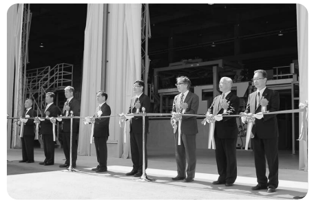
▲長良川木材事業協同組合の大型製材工場竣工式(9/28)