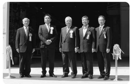
▲(株)TEKNIA郡上工場竣工式(9/19)