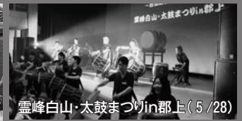
霊峰白山・太鼓まつりin郡上(5/28)