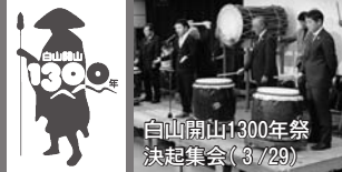
白山開山1300年祭 決起集会(3/29)

⑥白山が泰澄大師により開山されてから1300年を迎え、「白山開山1300年祭」のイベントや様々な関連行事が多数開催