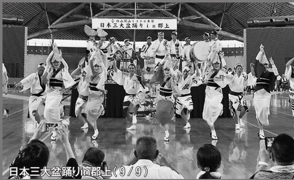
日本三大盆踊りin郡上(9/9)