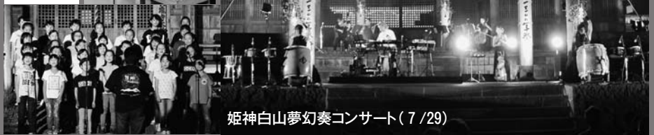
姫神白山夢幻奏コンサート(7/29)