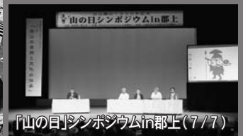
「山の目」シンポジウムin郡上(7/7)