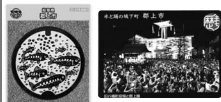
▲歴まちカード (歴史まちづくりカード)