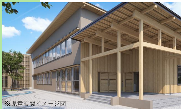
※児童玄関イメージ図