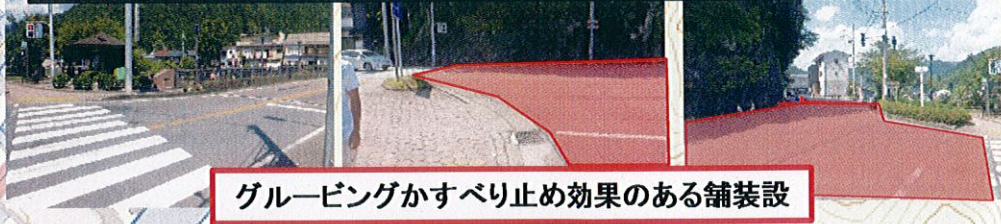
グレーピングかすべり止め効果のある舗装設

冬期に雪が解けにくく、車がすべりやすくなるため、すべり止め舗装かグレーピングが出来な