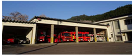
郡上市消防本部・郡上中消防署