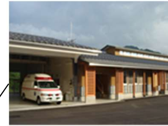
郡上中消防署東詰所