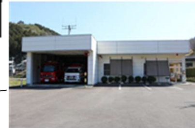
郡上中消防署南出張所