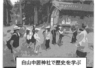
白山中居神社で歴史を学ぶ

5年生は、石徹白小5年生の皆さんと一緒に、1泊2日の宿泊研修を実施。白山中居神社様、石徹白洋品店様、あゆパーク様のご支援をいただき、歴史学習、藍染め体験、投網体験、飯盒炊飯等を体験しました。神社での凛とした雰囲気や、藍染め体験でのにおいや手触り、投網の感覚、火を使って炊くご飯の味など、五感を使った体験学習。きっと、いつまでも記憶に残ることだと思います。宿舎では、一人一人が“みんなが楽しめるように”という思いをもって、レクレーションを盛り上げている姿が微笑ましかったです。この研修から、学校を離れたところで共に活動する中で、郷土への愛着や協働する力を育むことができました。