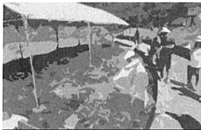
投網体験、なかなかムズカシイなあ