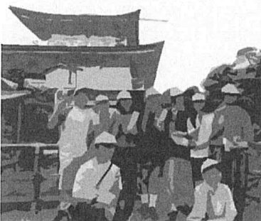
世界遺産「金閣寺」の前でピース!