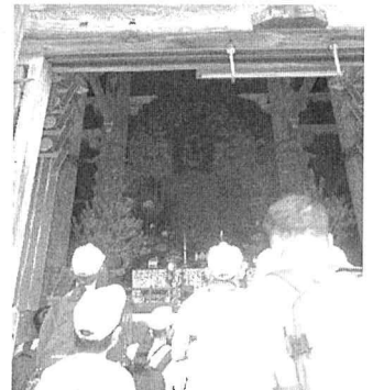
「東大寺」全長15mの大仏の迫力を実感。「お～！」

6年生は、牛道小、那留小、石徹白小、大中小の6年生の皆さんと合同で奈良・京都修学旅行を実施。(台風6号発生で実施できるか心配でしたが…ヨカット!) 1日目は奈良の法隆寺、東大寺、奈良公園(春日大社)、2日目は京都の清水寺、二条城、金閣寺を見学しました。立派だったのは、どこでもしっかりとあいさつができたこと、見通しをもって行動できたこと、班活動等で困ったときは仲間と会話をして協力して解決できたこと。互いを尊重する“思いやり”の心が育っていると感じました。日本の歴史、伝統の重みを自らの目で確かめるよい機会になりました。また、日常を離れた集団生活の中で、自立心(主張力)や協調性(尊重力)といった「未来を生き抜く」ために必要な力を育む一助になっていたことが、大きな成果でした。