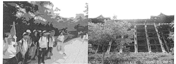
「清水の舞台」を下から眺めてオ～!