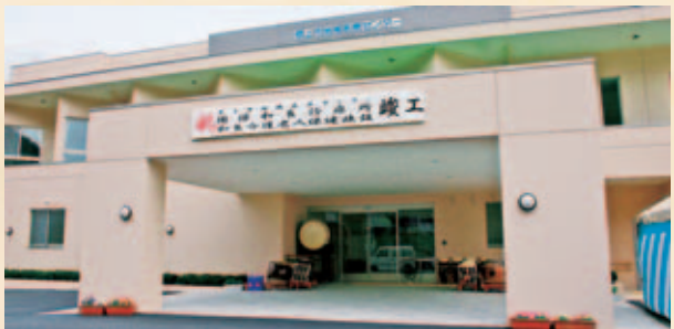
▲国保和良診療所、和良介護老人保健施設が竣工