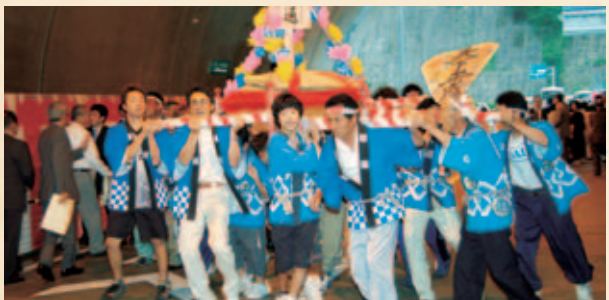
▲一般国道256号タラガトンネルが開通

平成19年3月に明治6年から開校した歴史ある相生第二小学校(八幡町相生)が134年の歴史に別れをつけました。閉校式では、卒業生や地域の住民ら約150人が出席し名残り惜しみました。7月には郡上市地域医療センター「国保和良診療所・和良介護老人保健施設」が完成し祝いました。総事業費7億9千万円で建設された病棟は、診療所8床と介護老人保健施設分20床で竣工しました。また、8月には、関市板取と八幡町那比を結ぶ国道256号タラガトンネルが完成し、関係者らが開通を祝いました。トンネルが開通したことで、これまで約25分を要したタラガ峠の通行時間が約6分短縮されるほか、大雨等の通行規制や冬季閉鎖も解消されました。