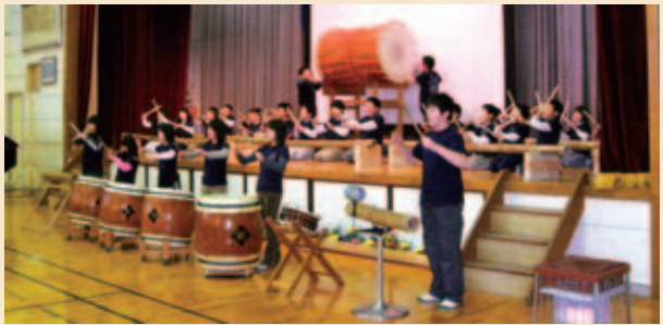
▲郡上市立相生第二小学校が閉校