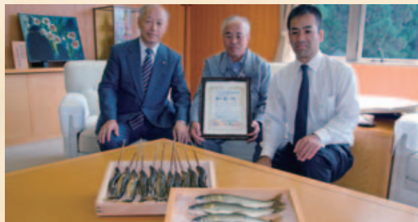
▲「清流めぐり利き鮎会」で和良鮎が2度目のグランプリ受賞