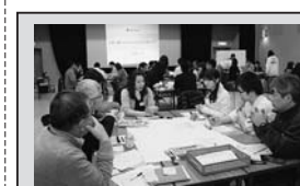
国や県の方針を受け、郡上市総合計画策定に向けて市民のみならず、地方創生推進に取り組みます。