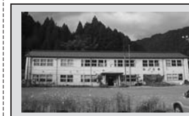
耐震補強が困難な小川小学校（明宝）の改築を実施し、平成27年度中にすべての小中学校施設の耐震化を完了します。