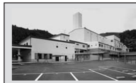
廃棄物処理対策について、適切な運営に努め、ごみ減量対策として、4Rの推進、分別の徹底、生ごみ減量化の推進等に努めます。