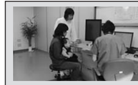
子育ての応援として、母子1ヵ月健診にかかる費用を郡上市が負担します。