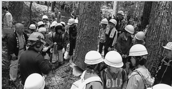
5月23日に開催された「郡上市みどりの祭り」

森林の恵みや森林を守り育てることの大切さについて考えるため「郡上市みどりの祭り2015」及び「100年の森づくりリレー伐採式 in 郡上」を美並町の粥川の森で開催しました。会場では、樹齢約110年のスギの巨木が伐採されました。伐採されたスギは、県内の市町へリレーされ、第39回全国育樹祭会場の揖斐川町へ運ばれます。