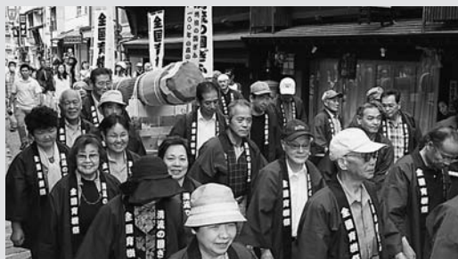
6月7日に開催された「100年の森づくりリレー」

このリレーに先立ち、6月7日(日)八幡町において出発式を行いました。丸太を載せた木曳車は、日吉神社の大神楽の先導により十六銀行八幡支店前から旧庁舎記念館前まで約200人の市民により木曳きされ、会場では、郡上おどりや日吉神社大神楽が披露されました。