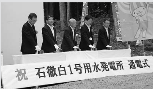
通電スイッチを押す様子

岐阜県が白鳥町石徹白地内で整備を進めてきた農業用水を活用した小水力発電所「石徹白1号用水発電所」の通電式が行われ、発電が始まりました。一般家庭約81世帯が1年間に使用する電力が発電可能で、発電した電力は、電力会社に売電します。