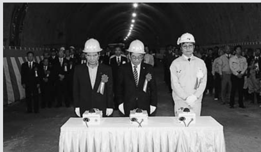
貫通発破ボタンを押す様子

東海北陸自動車道四車線化に伴う白鳥トンネル(白鳥町)の貫通式が白鳥IC～高鷲IC間のトンネル内で行われました。貫通式では、関係者約100人が出席し、貫通を祝いました。白鳥トンネルは、白鳥IC～飛騨清見IC間の四車線化事業の工区にある11のトンネルで最も南に位置し、初めての貫通になります。