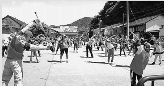
◀出発前に準備運動をする参加者

晴天の中、長良川清流ウォーク&ノルディックウォークを開催しました。6歳から85歳までの参加者107人が、郡上市スポーツ推進委員とともに、長良川鉄道郡上八幡駅から市役所大和庁舎までの長良川沿いのコース11キロを歩きました。また今回は、岐阜県ノルディックウォーク連盟から指導員を派遣していただき、ノルディックウ