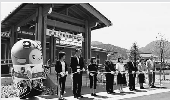
◀テープカットを行う関係者のみなさん

昭和37年に建築された旧市役所和良庁舎（旧和良村役場）は、建築から53年が過ぎ老朽化が著しく、また平成24年には、庁舎敷地が土砂災害特別警戒区域に指定されるなど、移転建て替えが課題となっていました。和良地