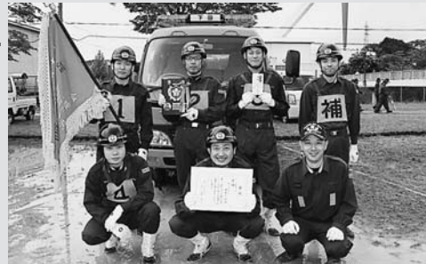
優勝した美並方面隊のみなさん

第12回郡上市消防操法大会がまん真ん中広場(美並町)で開催され、市内7方面隊の代表チームが日頃の練習の成果を発揮し、自動車ポンプを駆使して標的を倒すタイムや、正確な動作・規律などを競い合いました。優勝した美並方面隊は、8月2日(日)に津海市で行われる岐阜県消防操法大会に郡上市代表として出場します。