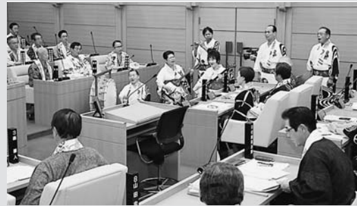
◀議場でお囃子を披露する保存会のみなさん

今年も市議会では「ゆかた議会」と銘打ち、7月～9月の「郡上おどり」「白鳥おどり」を盛り上げるため、6回目の「ゆかた議会」を開催しました。今回、初めて「郡上おどり保存会」のみなさんに議場でお囃子を披露していただき、三味線と笛、太鼓に合わせた唄が響き渡りました。