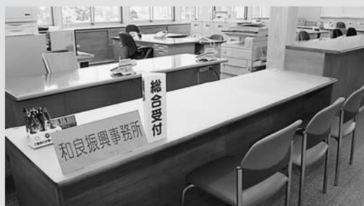
◀公開された和良振興事務所の新総合窓口

域では、旧和良病院の跡地利用が検討され、この度、和良振興事務所と中消防署東詰所を併設し、各種機関（漁協、商工会、森林組合）を集約した和良庁舎が完成しました。構造材には、和良財産区有林から提供を受けた木材を使用しています。