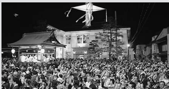
◀屋形を中心に幾重にも広がる踊りの輪

国重要無形民俗文化財「郡上踊」が7月11日(土)、郡上八幡旧庁舎記念館前で開幕しました。神事・式典に続き、市街地を練り歩いたおどり流しの行列が会場に到着。日置市長が開幕を宣言すると、「古調かわさき」のお囃子に合わせ、シーズンの到来を待ちわびた浴衣姿の踊り手、約10,500人が幾重にも踊りの輪を広げました。