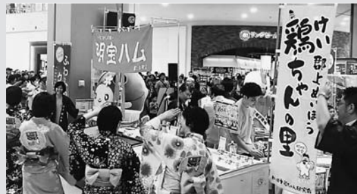
◀多くのみなさんが来場されたイベント会場

市の魅力ある特産品と販路拡大をめざした物産展「まるごと郡上フェア」を、名古屋港区のイオン名古屋茶屋店で開催し、市内業者12社が約130品目を出展しました。会場では郡上おどりの開幕を1週間後に控え、郡上おどり保存会ジュニアクラブによるおどりの実演も行いました。