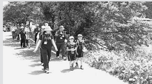
◀晴天の中、楽しくウォーキングするみなさん