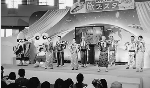
◀郡上おどりを踊る3市長

金沢市で開催された北陸最大級の旅イベント「MRO旅フェスタ2015（主催：北陸放送㈱）」に岐阜・下呂・郡上観光宣伝協議会で初出展し、北陸のみなさんにトップセールス・プロモーションを実施しました。ステージでは、各市の夏のおすすめを紹介し、郡上おどりの実演も行いました。