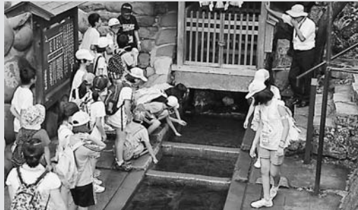
◀八幡小学校の児童の散策する様子

友好都市の東京都港区との子ども交流事業として、港区の小学4~6年生(赤坂小、青山小、青南小)47人が市内を訪れ、自然の中で遊びながら命や自然の大切さを学びました。児童らは2泊3日の行程で、市内の散策や郡上おどりによる交流、農家民泊での農業体験や鮎釣りなどを楽しみました。