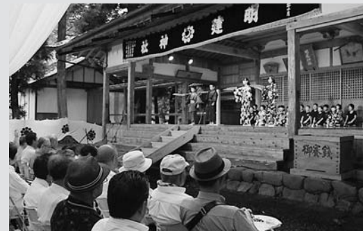
◀稽古に励んできた仕舞を披露する児童ら

大和町牧地区の明建神社で、今年も新能「くるす桜」が奉納されました。大和南小学校5、6年生がこの日のために稽古を重ねた仕舞「合浦」を披露した後、拜殿両脇のかがり火が燃え上がる幻想的な雰囲気の中、能「くるす桜」や狂言などが上演されました。