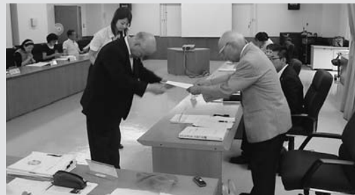
◀日置市長から委員へ委嘱書を交付する様子

平成27年度第1回郡上市子ども・子育て会議が市役所で行われ、新委員の委嘱式が行われました。任期は平成29年3月31日までです。委員からは平成26年度に策定した子ども・子育て支援事業計画の実施状況の点検・評価や子ども・子育て支援に関する意見や提言をいただきます。