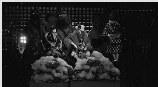
明建神社で公演された様子

今年で3回目となる「人形浄瑠璃ヌーベルバーグ」が明建神社(大和町牧)で開催されました。今回は、地元 はなはなきけらくじつのおの に伝わる話をもとにした「母情落日斧」が上演されました。現代音楽にあわせ浄瑠璃人形が生き生きと舞台の上を動き、新しい人形浄瑠璃の可能性を体感した一夜となりました。