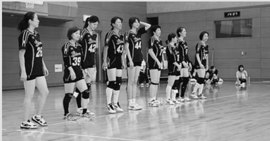
◀ 郡上に集結した元全日本代表バレーボール選手