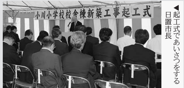
起工式であいさつをする日置市長

明宝の小川小学校の校舎棟新築工事起工式が行われ、関係者約60人が出席しました。現在の校舎は1955年建設で60年が経過し、耐震性能が不足していることなどから、新築されることとなりました。新校舎は、木造平屋で地元産材を使用し、保育園を併設します。