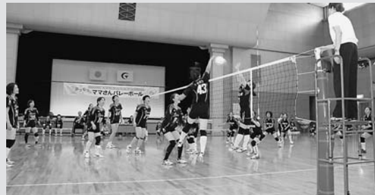
◀ 地元チームと対戦する元全日本代表バレーボールチーム

9日(日)は、バレーボール教室に加え午後からはジュニアダンスクラブ、スーパークッキーズの元気なダンスでスタートしました。その後、行われたフレンドリーマッチでは、ドリームチームと地元ママさん選抜3チームが対戦し、来場した約800人のみなさんは、迫力ある対戦に盛り上がりました。