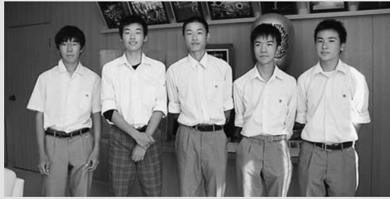
◀ 日置市長へ開催報告をした高校生のみなさん

また、11日(火)には、初めて開催した「中高生鮎友釣り選手権」の開催報告を日置市長に行うため、実行委員の生徒らが市役所を訪れました。