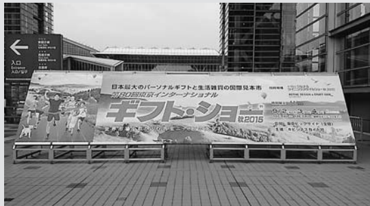
会場に設置された案内看板

郡上産品等発信推進協議会では、市内産業の振興及び地域活性化のため、郡上市内で生産、製造される産品、技術、サービス等の宣伝・PR並びに販路拡大のため、ビジネスフェアへの出展を支援しています。今回9月2日(水)～4日(金)の3日間「Gift Show2015」「グルメ&ダイニングスタイルショー秋