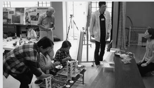
8種類の鶏ちゃんを食べ比べる参加者のみなさん

平成27年度第1回郡上學テーマ設定講座「鶏ちゃん講座」を明宝コミュニティセンターで開催しました。講座では、8種類の鶏ちゃんを食べ比べや鶏ちゃんのイメージやルーツなどの講座を受け、里山の生き方や鶏ちゃんを通じた地域づくりなどを楽しく学びました。