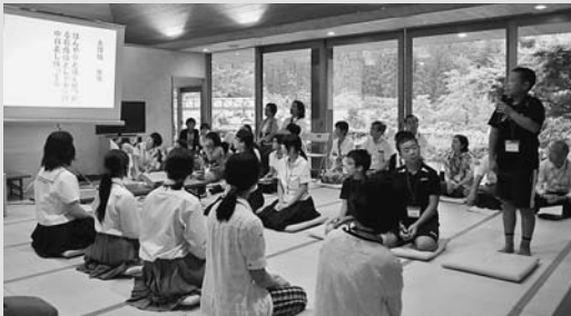
短歌を詠み、批評し合う児童たち

古今伝授の里フィールドミュージアムで、「短歌道場in古今伝授の里」が開催され、市内の小中学生をはじめ全国から約70人が参加しました。また、大学生部門では8チーム参加し、京大短歌チームが優勝しました。この「短歌道場」は、お互いに短歌を批評し合い、審査員が優劣を判定しました。