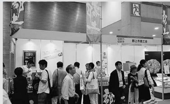
来場者で賑わう郡上ブース

2015」(東京ビッグサイトにて同時開催)に郡上ブースとして共同出展しました。協議会では、郡上市内の多くの企業に会員となっただき、積極的に商談会出展を支援しています。協議会に関するお問い合わせは、市役所商工課でお受けしています。(☎67-1808)