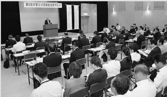
あいさつをする日置市長

木曾三川（長良川、木曾川、揖斐川）流域の27市町村の首長ら約100人が環境保全、利活用などを考える「第5回木曾三川流域自治体サミットin郡上」が郡上市総合文化センターで開催されました。このサミットは、流域自治体の連携による水環境保全を目的に、木