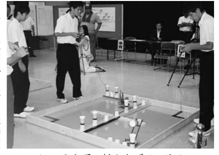
▲アイテムを上手に持ち上げるロボット

コンテストは2つの部門で行われました。基礎部門では障害物(板による段差)が設けられたコースを往復し、品物を運ぶタイムを競いました。各自が工夫して作成した歩行ロボットの性能と操作技術で、息詰まる試合が繰り広げられました。