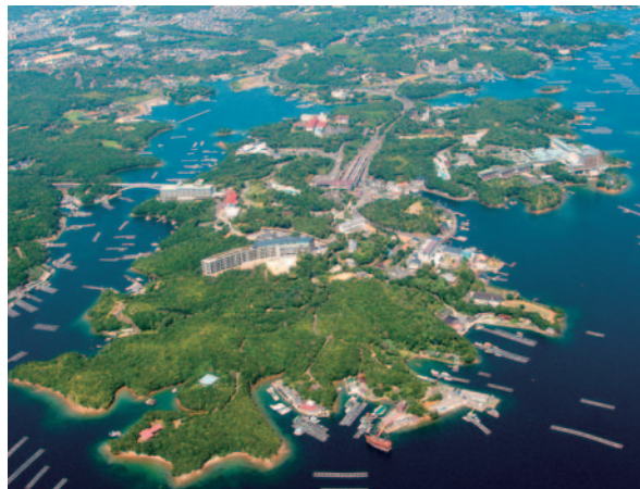
▲サミットの会場となる賢鳥