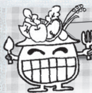
「たんご君」 （郡上市食育キャラクター）

もし接種を希望される場合は、健康課（☎ 88-4511）までお問い合わせください。