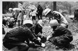
◀郡上市みどりの祭り 植樹の様子