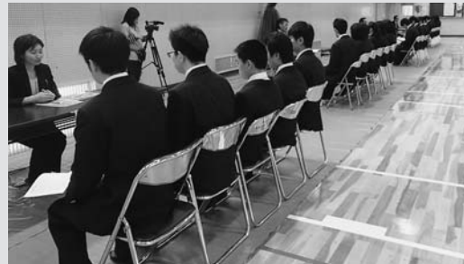
▲企業からの説明を聞く生徒のみなさん

郡上市雇用対策協議会では、郡上市内の中学、高校、特別支援学校の生徒のみなさんの職業意識啓発を目的とし、毎年「郡上未来塾」を開講しています。今回は、市内8事業所から講師を招き、自分自身の将来について意識を持ってもらうことや、地元の産業等の理解を深めてもらうための説明会が開催されました。