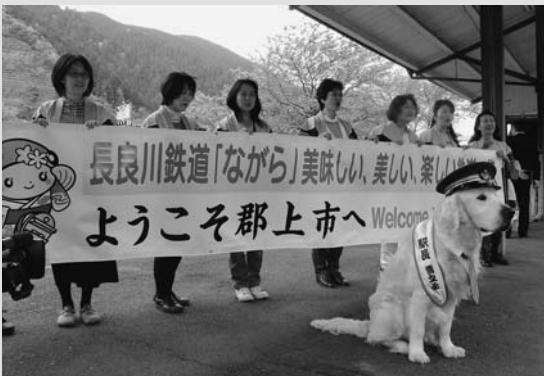
◀市商工会女性部八幡支部による横断幕での歓迎(郡上八幡駅)