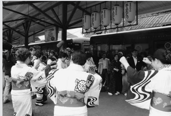
◀郡上おどり保存会による歓迎(郡上八幡駅)