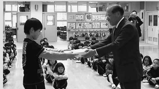
◀人権擁護委員からひまわりの種を受け取る児童

岐阜地方務局八幡支局と県人権擁護委員連合会から人権推進校に指定された高鷲北小学校で指定書の交付式があり、指定書の交付とともに、昨年度推進校に指定された白鳥小学校で育てられた「人権ひまわりの種」が高鷲北小学校児童のみなさんへ引き継がれました。