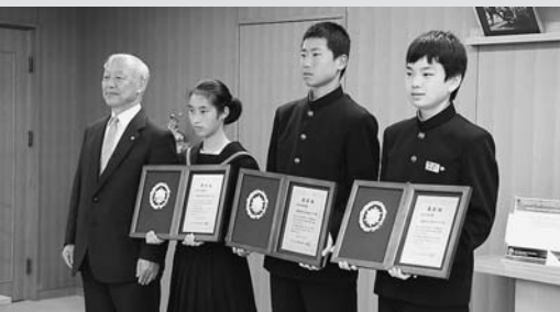
◀日置市長に受賞報告をした生徒のみなさん

八幡中学校、郡南中学校、郡上東中学校の少年消防クラブが、平成27年度優良な少年消防クラブ表彰(消防庁長官表彰)を受賞し、クラブ指導者(教諭)とクラブ員(生徒)の代表から日置市長に受賞報告が行われました。少年消防クラブは、防火・防災思想の普及を図ることを目的に、日ごろから訓練や研修会などを行っています。