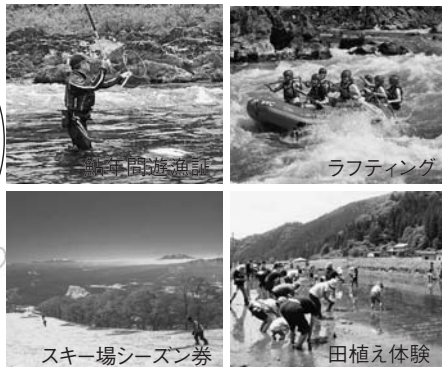
▲新設した体験型返礼品の一例

昨年度から、「ふるさと郡上」の魅力体験し、満喫していただける体験型の返礼品として、「ふるさと郡上満喫体験」を新設いたしました。市外にお住まいのご家族、ご友人のみなさんに、ぜひ、この返礼品をご案内ください。