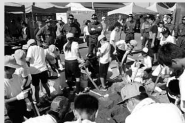
◀小中学生による土嚢作成訓練