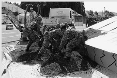
◀土砂埋没家屋からの救出訓練