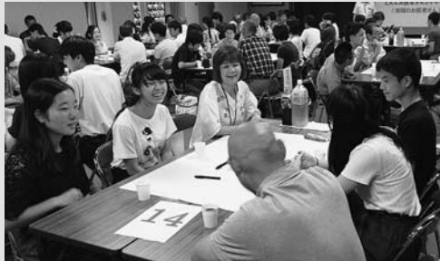
◀地元のみなさんとの地域医療に関する意見交換会の様子

岐阜県及び県北西部地域医療センターが、へき地医療を支える人材育成を目的として「第8回岐阜県へき地医療研修会」を開催しました。医師を目指す高校生や大学医学部生の58名が参加し、市内及び近隣の診療所の見学や和良・西和良・小那比のみなさんと地域医療に関する意見交換会を行いました。