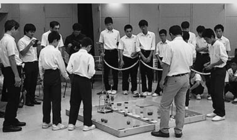
◀それぞれ工夫を凝らしたロボットで競いました

市総合文化センターにおいて、「中学生アイデアロボットコンテスト」が開催されました。コンテストは、歩行型ロボットの性能を競う「基礎部門」と、プラカップのゴールにボールを入れあう「活用部門」で行われ、アイデアや性能が異なるロボットが集まり、白熱した試合が展開されました。