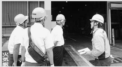
◀若手社員から説明を受けながら見学する参加者のみなさん

市雇用対策協議会、市教育委員会では、小中学校の先生が市内の企業を知ることで、子どもたちの将来を見据え、視野を広げることを目的として企業見学研修会を開催しました。当日は20名が参加し、「経営者、従業員の熱意や信念が聞けて有意義だった」と感想を述べていました。