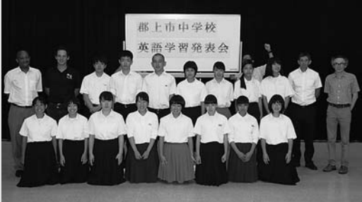
◀発表会に出場した中学生と審査員のみなさん

市総合文化センターにおいて、「郡上市中学校英語学習発表会」が開催され、市内8中学校より15名の生徒が参加しました。生徒は、日々の暮らしの中で感じていることや、今、夢中になっていることについてジェスチャーを交えながら、表情豊かに英語でスピーチ発表をしました。