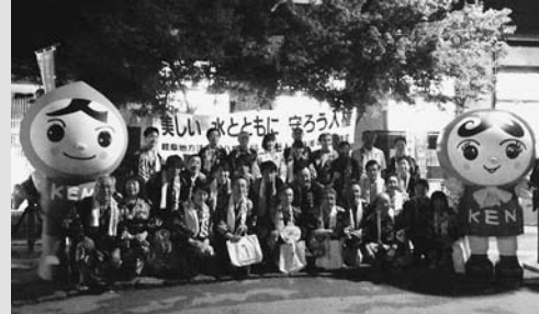
◀啓発活動は郡上八幡駅前のおどりで会場で行われました

郡上おどりを訪れるみなさんを対象に、郡上人権擁護委員と岐阜地方裁判所八幡支局が中心となり、人権啓発活動が行われ、「人権うちわ」が配布されました。この活動は平成11年から毎年継続して実施されており、人権イメージキャラクター「人KENまもる君と人KENあゆみちゃん」も参加しました。