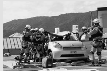
◀車両からの救助訓練