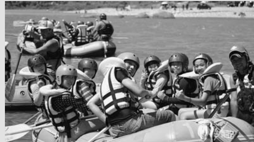
◀ラフティングを楽しむ港区の子も達

郡上市と友好都市の東京都港区の子ども交流事業として、港区の小学4~6年生(赤坂小、青山小、青南小)62人が市内を訪れ、豊かな自然の中で遊びながら命や自然の大切さを学びました。児童は2泊3日でラフティングや郡上おどり、農家民泊などを体験し、地域の人と交流を深めながら楽しい時間を過ごしました。