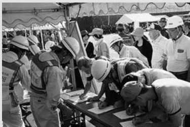
◀自主防災会避難訓練

訓練には、陸上自衛隊第35普通科連隊ほか39団体から合わせて約700人の参加があり、災害時に必要な関係機関相互の連携を確認するとともに、自主防災会による避難訓練や、小中学生による応急処置訓練、土嚢作成訓練、初期消火訓練などが行われました。