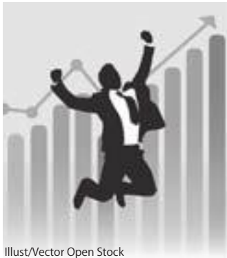
Illust/Vector Open Stock

起業、事業承継、拠点開設、商品開発、販路拡大、 売上・利益向上、人材確保、移住の