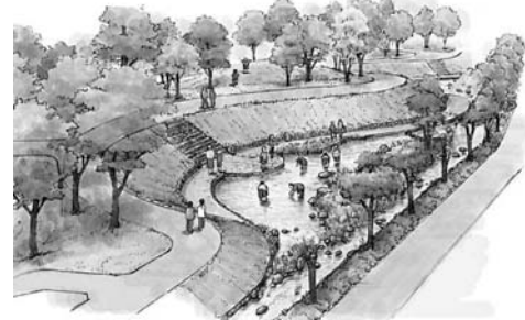
▲魚ふれあい水辺(イメージ図)