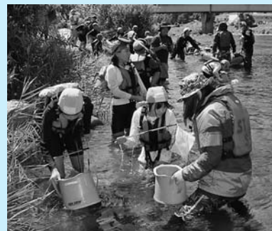
◀水中観察・魚とり体験