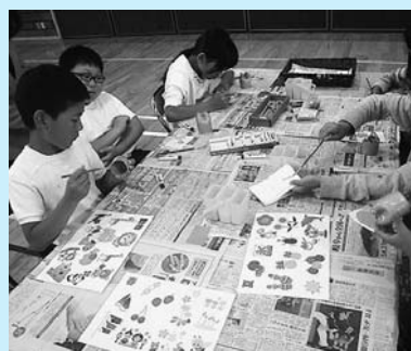
◀室内体験(風鈴づくり)