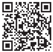
「きずなネット」アプリ QRコード