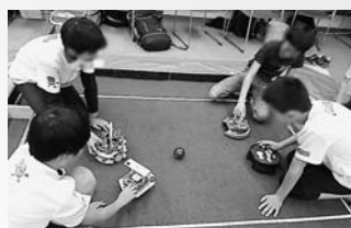
▲ロボットにサッカーをさせます

HUB GUJOには高速なネットワーク環境だけでなく、3Dプリンタが設備として用意されており、試作品の作成のためによく使わせていただいています。3D