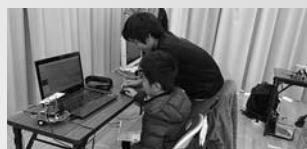
▲プログラミングは先輩も教えてくれます

プリンタもロボットのひとつです。3Dプリンタはコンピュータで設計した部品を作ることができ、人が作るよりも正確に、速く作れます。言われた通りに作るだけならば人よりもロボットのほうが優れていると思います。