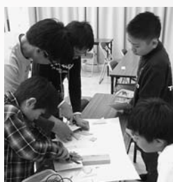
▲のこぎりを使って板を切ったり、はんだごてを使ってセンサーを取り付けたりします