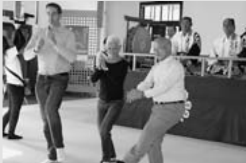
◀日置市長と郡上おどりを踊るクリンケルト議長(中央)とベシュト所長(左)

市は、欧州からの誘客を進めるため、オ＝ラン県カイゼルスベルクとの交流に向け取り組んでいます。