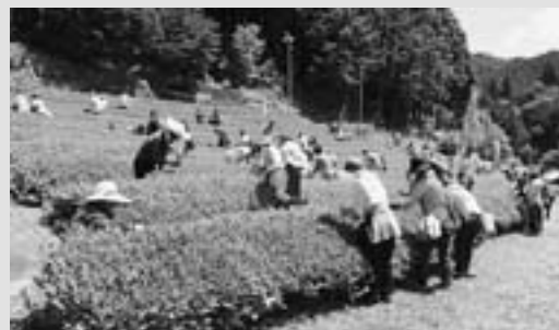
◀茶畑で、一生懸命新芽を摘む参加者のみなさん

好天に恵まれ、県内や愛知県から家族連れ約100人が参加されました。参加者のみなさんは、茶畑で新芽を摘み取り、製茶工場で茶もみを体験するなど新茶の香りに包まれながら、1日を楽しみました。