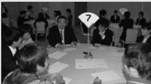
◀グループワークを通して交流を深める参加者

市雇用対策協議会では、市内の事業所等の新規就職・就業者を招き、激励会を開催しました。今年度は、99人が参加され、同世代同士の交流や情報交換が行われました。また、『企業の利益と個人のお金の使い方』についてのセミナーを受け、新社会人として必要な知識を学びました。