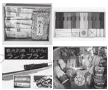
▲追加した返礼品の一例

できる「ながらランチプラン」や「ながらスイーツプラン」、お子様が木に触れ親しむことができる「郡上八幡のグラデーション積み木」等積み木のセット、その他にも市の食材を使った加工食品やスイーツ等を追加しました。市外にお住まいのご家族、ご友人のみなさんにぜひこの返礼品をご案内ください。