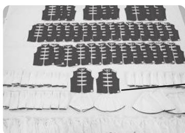
▲幼年消防クラブ鼓笛隊 ユニフォーム上下セット