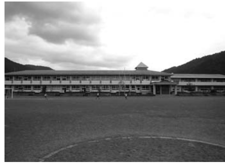
統合校舎として活用する予定の大和北小学校

教育委員会では、令和元年度に「郡上市学校体制検討委員会」の答申を基に、市の学校を取り巻く現状を踏まえ、学校規模適正化の必要性、適正化によって期待できる教育的効果、段階的な適正化のためのプランを内容とする郡上市学校規模適正化計画を策定しました。その中で、大和地域の4つの小学校に関して、保護者のみなさんや地域協議会などからのご意見を踏まえ、早期の統合を計画しております。