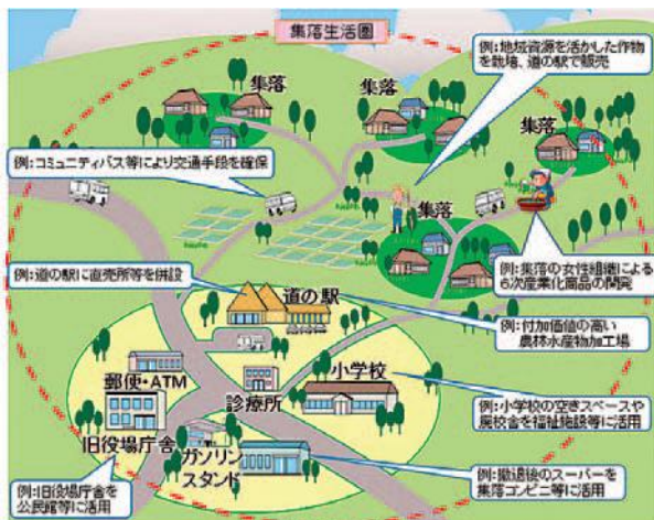
小さな拠点のイメージ 内閣府

将来にわたって安心して住み続けられるよう、小学校区など複数の集落が集まる基礎的な生活圏（集落生活圏）の中で、分散している買い物や福祉、医療など様々なサービス機能を一定の範囲に集約し利便性を高めるとともに、移動手段の確保や集落間の助け合い・連携など、交通や人、情報等をネットワークでつないでいく「小さな拠点」を形成していく必要があります。そして、これらの地域の実情に応じてつくられた「小さな拠点」同士が、複合的、重層的な「ネットワーク」を形成することで、互いに機能を補いあい、地域での暮らしを総合的に支えていくことが「小さな拠点とネットワーク」の考え方です。