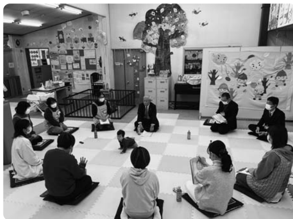
▲子育て支援団体「バンビの森」

【18ページ、19ページに関する問い合わせ】 市長公室秘書広報課 ☎67-1121 ✉kouhou@city.gujo.lg.jp