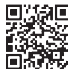
▲市HP「郡上市都市交流 推進事業補助金」