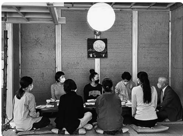
▲高鷲郷土料理を後世に残す会