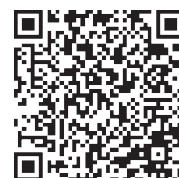
▲市HP「ふれあい座談会」