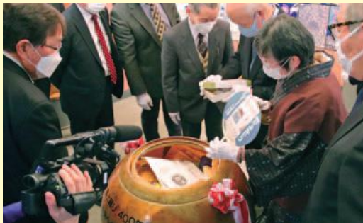
▲懐かしそうにカプセルの 中身を見る参加者

平成3年度に開催された郡上おどり400年祭で埋設されたタイムカプセルの開封セレモニーが、郡上八幡博覧館で開催されました。タイムカプセルの中には応募により集められた793通のメッセージと、当時の記念品、資料等が納められており、それを見ながら参加者のみなさんは当時の思い出を語り合っていました。