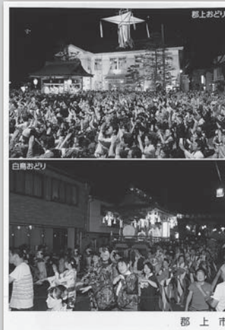
ポストカード写真