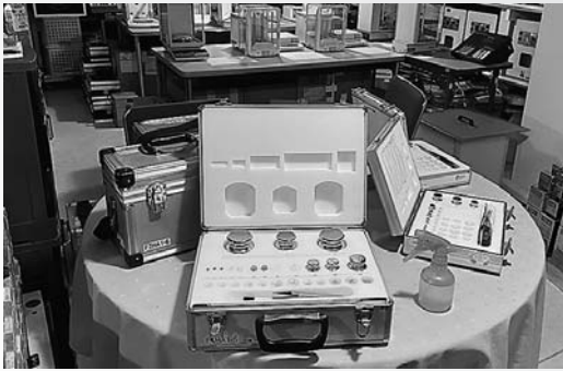
精密分銅(手前)と超高分解能はかり群(奥)

が悪い場合は、永遠に測定が終わらないという最悪な状態に陥ります。そこで私共は、最良の測定環境である郡上に試験所を構えました。