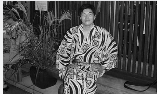
プライベートでは郡上の風情ある街を満喫

郡上の地盤はとても堅牢な岩盤質のために、周囲から伝わってくる振動もありません。郡上の川沿い建築特有の半地下構造を利用したおかげで、検査室は一日を通して温湿度変化も最小に抑えられています。また、山間の割に気圧が安定しているため、頑強で高額な建屋や特殊な環境制御設備無しで、高精度の計量・計測が実現できています。私共にとっては「郡