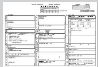
求人票(フルタイム)