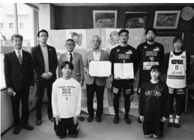
▲調印式に参加したみなさん