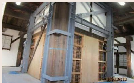
取り付けられた補強鉄骨

木造の天守閣である郡上八幡城の耐震補強は、鉄骨材を既存の柱などに添わせていきます。設置した鉄骨は床下から最上階までつながっており、木造部分と補強部分を一体化しています。