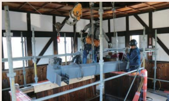
耐震補強材搬入の様子

八幡城における各城主や藩主の歴史を学ぶことができます。また、青山家にまつわる刀剣や、市指定文化財の甲冑など、貴重な資料も展示していますので、ぜひお越しください。