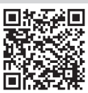
市営住宅 募集一覧