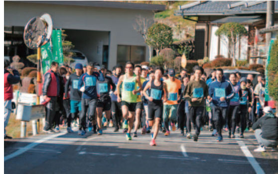
▲マラソンに参加するランナーのみなさん

年明けに和良町を駆け抜ける「ニューイヤーズマラソン2024 in WARA」が開催され、市内外から参加した101人が走り初めを楽しみました。5キロと2.5キロの2コースが設定され、完走した参加者は「元旦にふるさとをとてもいい気持ちで走ることができて満足です」と話していました。