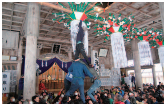
▲花笠を落とそうとする若者たち

長滝白山神社（白鳥町）で六日祭が行われ、国重要無形民俗文化財「長滝の延年」が古式ゆかしく奉納されました。別名「花奪い祭り」と呼ばれ、拜殿天井に吊るされた花笠を勇敢な若者たちが落とすと、参拝者らは我先にと花を奪い合いました。この花を持ち帰ると、豊蚕、豊作、家内安全、商売繁盛になるといわれています。