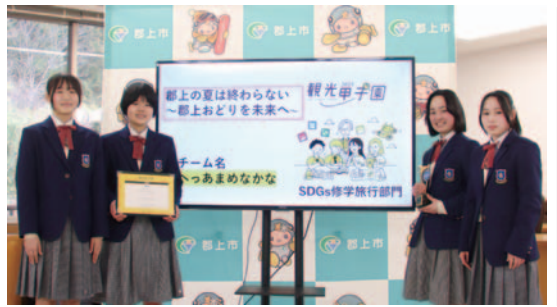
◀チーム「へっあまめなかな」のみなさん

全国の高校生がSDGs思考で観光事業企画を競う「観光甲子園」の「SDGs修学旅行部門」でグランプリに輝いた郡上高等学校2年生のチーム「へっあまめなかな」のみなさんが日置市長に受賞を報告しました。郡上おどりを次世代に継承するプランを提案し、「卒業後もこのプランの実現に関わっていきたい」と誓いました。