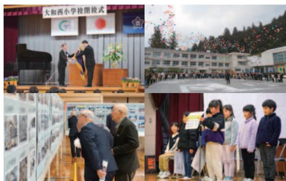
◀ 南小（右上） 第一北小（右下） 西小（左上） 北小（左下）

大和地域4つの小学校で閉校式が行われ、それぞれ150年という長い歴史に幕を下ろしました。式典では校旗返納や校歌斉唱、記念行事ではバルーンリリースや活動報告、タイルアートの除幕式、昔の写真展示等が行われ、関係する多くのみなさんがお世話になった学び舎に感謝し、別れを告げました。