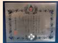
銀色有功章 (個人・法人)