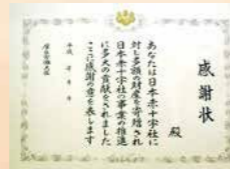
厚生労働大臣感謝状

※分納の場合は、初回寄付の前に、予め分納のご意志をお伝えいただく必要があります。