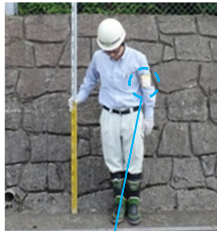
携帯する身分証明書