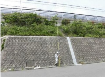
急傾斜地の計測例