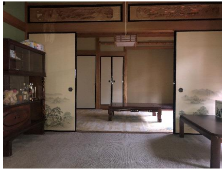
▼1階和室（手前8帖・奥6帖）