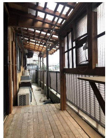
▼1階デッキスペース