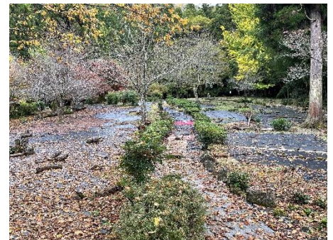
▼田畑 (車で約 10 分)