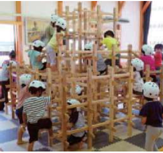
▲木製ジャングルジムで遊ぶ子どもたち

郡上で生まれ育つ赤ちゃんに、早くから木に親しみを持ってもらえるよう、市内製造業者が手掛けた木製玩具を贈呈しています。また、市内の幼稚園・保育園等において、道具も材料も全て郡上産のスティムを使用した木製ジャングルジムづくり体験を実施しています。