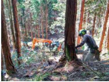
▲チェーンソーの技能講習

適正で安全な森林整備の実施及び野生鳥獣による森林被害を防止するため、専門的な知識や技術を有する人材の育成と新たな人材の確保を支援しています。森林施業に必要な資格取得のための講習会等の受講や開催にかかる経費を助成しています。