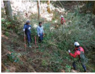
▲森林の境界を確認

所有者の管理が行き届いていない人工林の増加に伴い、山地災害のリスクが高くなっています。市では、林業経営に適さない森林(環境保全林)を対象に、森林所有者から経営管理を受託し、災害に強い山づくりを行っています。