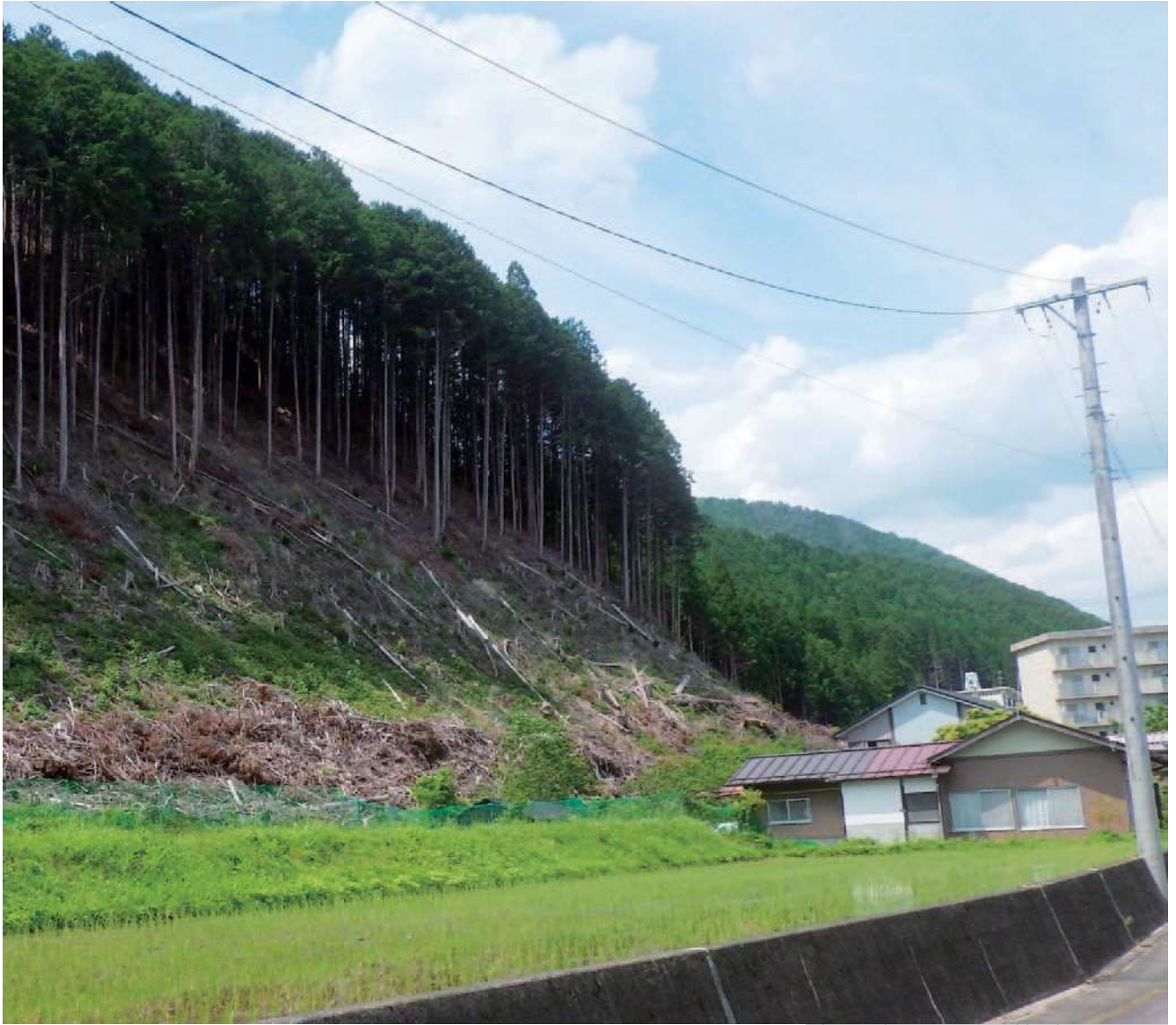
裏山の木を切って危険性を軽減しました